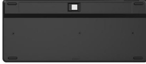
USB Nano Receiver Storage